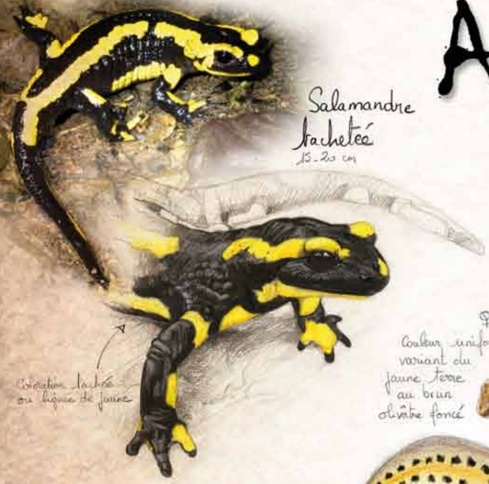
Salamandre tachetée 15-20 cm