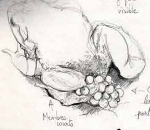
Alyte accoucheur 4 à 5 cm