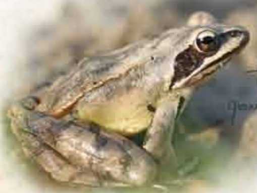
Rainette méridionale 4 à 5 cm

Absence de bande sombre le long des flancs